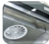
Sistema de aire forzado