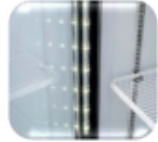
Iluminación interior luz LED